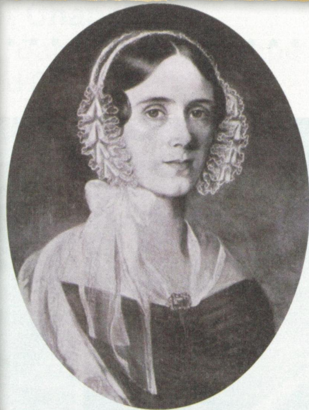
▲戴德生媽媽 賀雅美

1865年創立中國內地會，在他生前已差派800多位宣教士，遍佈中國內地18個省，被稱為“信心差會之父”。